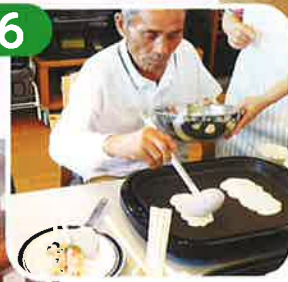
おいしくな～れ! どんどん焼き