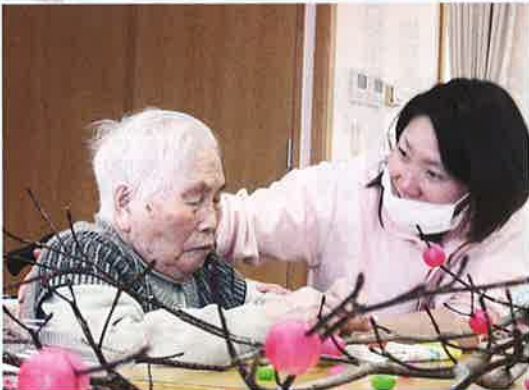
豊作を願いながら、 だんご木作り