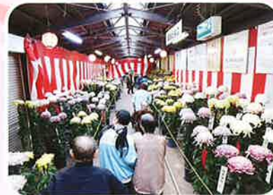
きれいだね～☆ 西川町の菊祭りに行って来ました。