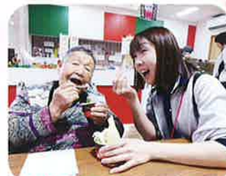
このアイス、んまいちゃ～