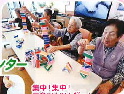
集中!集中! 三角ツムツムゲーム