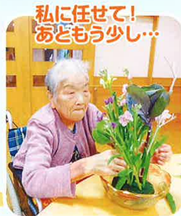
私に任せて! あともう少し...