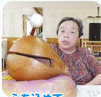
心を込めて、 まかはんじゃ～ は～ら～!