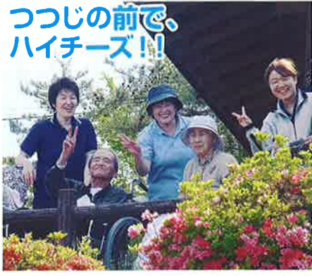
つつじの前で、 ハイチーズ!!