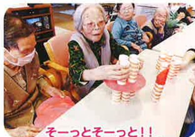
そーっとそーっと!! Xmasケーキ キャンドルゲーム