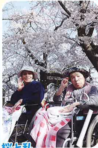
桜と私、 どっちがきれい?