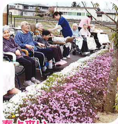
春よ来い 今年も咲くといいな