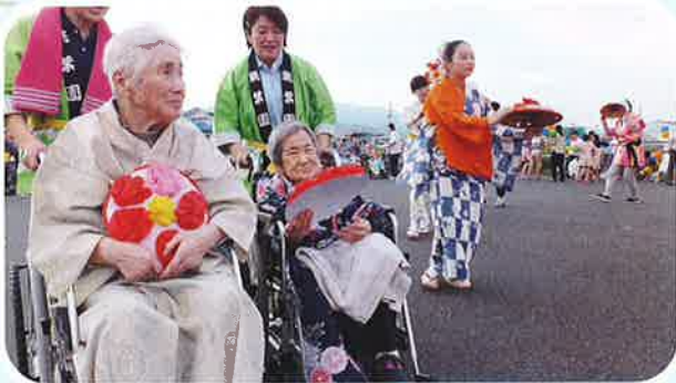
浴衣似合ってたが??