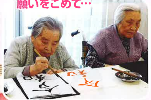
新しい時代に 願いをこめて...