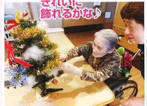
きれいに 飾れるかな♪