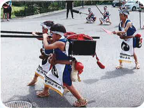
めんどいなあ、豆奴(^^)