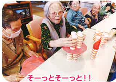
そーっとそーっと!! Xmasケーキ キャンドルゲーム