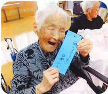
願いがかない ますように★