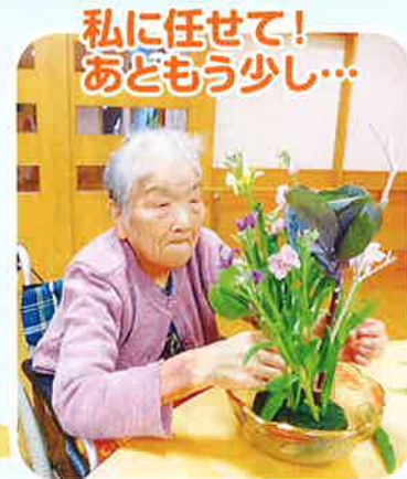
私に任せて! あともう少し...