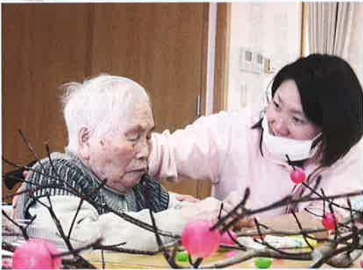
豊作を願いながら、 だんご木作り