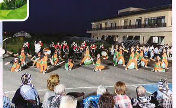
徳内ばやし in 眺葉園!!