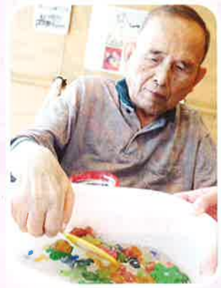
よく狙って 金魚すくうぞ!