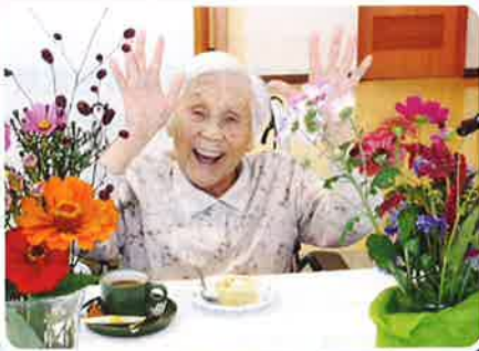
美味しいケーキに バンザイ!!