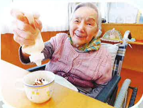
美味しそうだね~♥ もっと入れていいが?