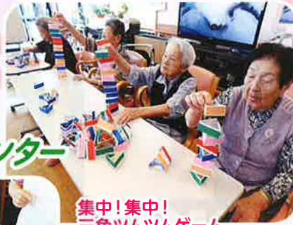
集中!集中! 三角ツムツムゲーム