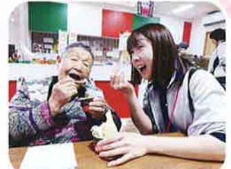
このアイス、んまいちゃ〜