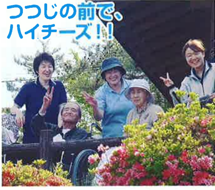
つつじの前で、 ハイチーズ!!