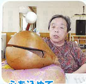
心を込めて、 まかはんじゃ～ は～ら～!