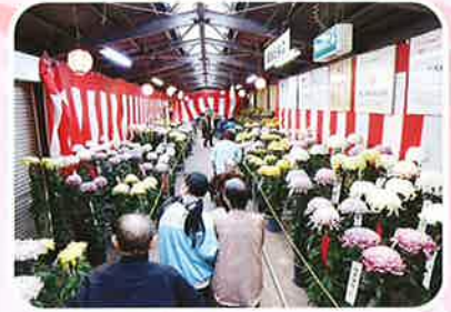
きれいだね〜☆ 西川町の菊祭りに行って来ました。