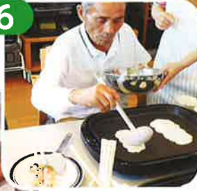
おいしくな〜れ! どんどん焼き